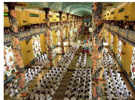
Queen Ann hotel**