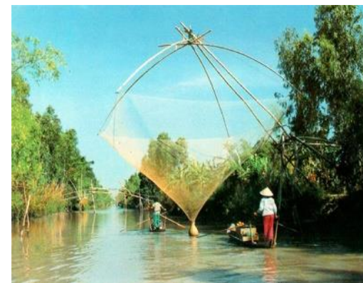
Chez l'habitant (chambre privée)

Diner et nuit chez l'habitant à Can Tho.